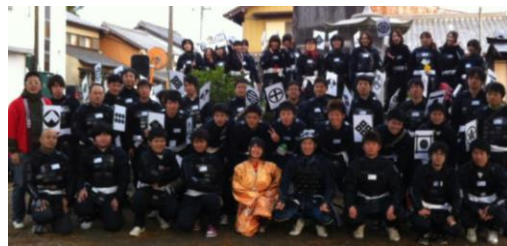
西濃武者祭り 大人武者全員集合！