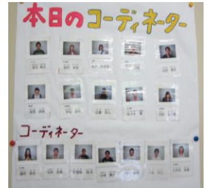
手作りの コーディネーター表