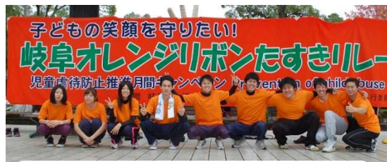
岐阜オレンジリボンたすきリレー ランナーが集合！