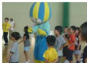
小中子ども交流会で 行われたミナモダンス