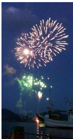
Light Up Nippon の花火