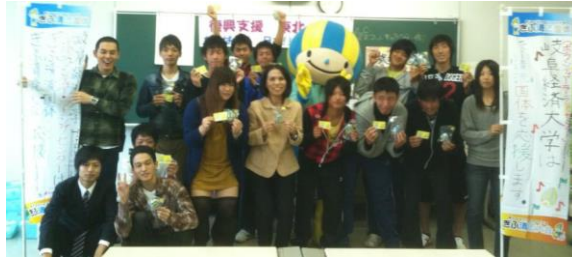
Volunteer Learning Center は、岐阜清流国体を応援します！