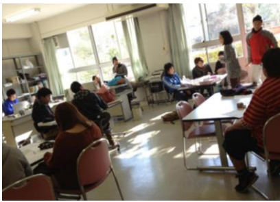
模様替えをしたよ♪