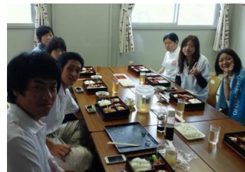
被災地支援合宿での つかの間の休息・・・