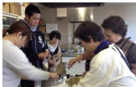
日赤奉仕団の方と 炊き出しの事前練習